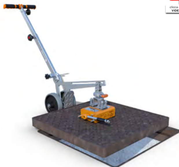
Carrello Simplex Magnetic